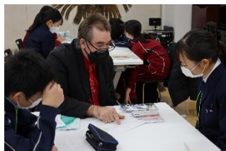
事前研修:ALTとの実践英会話

また、結団式(12月)と、研修全体についての報告会(2月)を行います。(日程は裏面をご覧ください。)