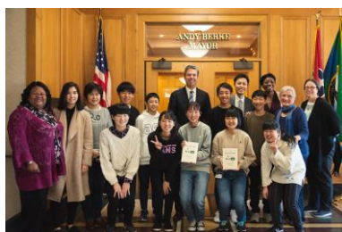
チャタヌーガ市役所訪問 (2020年1月中学生派遣)

現地で下記のような研修を行います。(今年度はホームステイではなく、ホテル泊となります。)