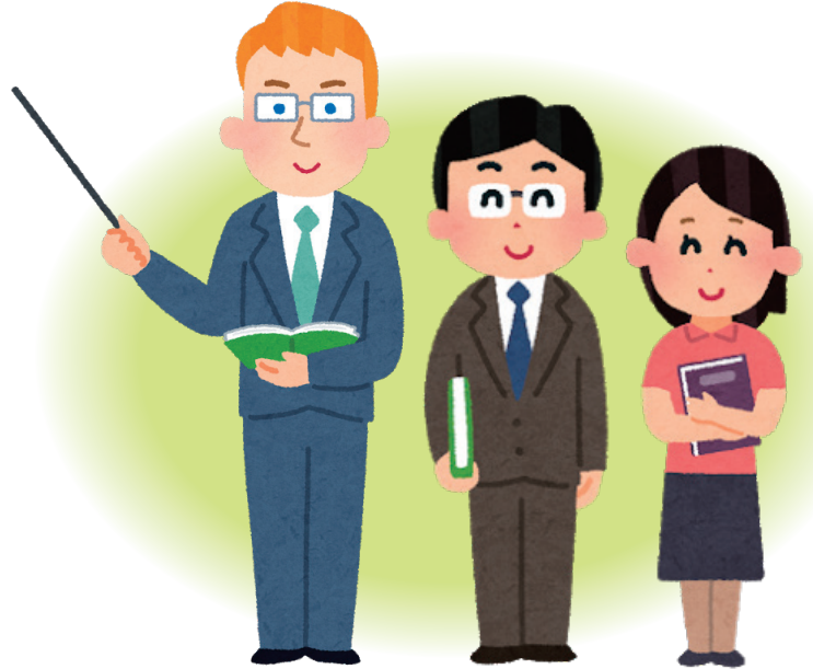
ALTと担任の先生をサポートできる人材を目指します

また、元学校の先生や、英語に関わる仕事をしていただいた方々の新規受講も歓迎しております。本年度も少人数定員での開講となります。ぜひご参加ください。