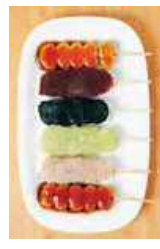
いつくしだんご Itsumushi Dango

부드러운 명물 강단을 먹어 보세요. 다양한 맛이 있습니다. Try the famous soft, chewy dumplings. Many flavors available.