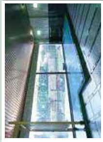
いつくし園 (大浴場・露天風呂) Itsu Kushien (public bath/open air bath)

請泡泡温泉感受一下日本吧! 请泡泡温泉感受一下日本吧! 온천에 썩 들어가 일본을 느끼지! Get a full feel of Japan in a hot spring!