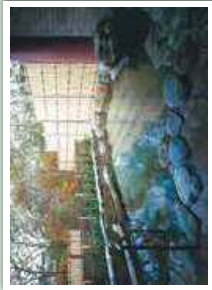
かんぼの宿一閑 (大浴場・露天風呂・家族風呂) Kampo no Yado Ichinoseki (public bath/open air bath/family bath)