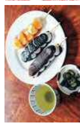
郭公だんご Kakkō Dango