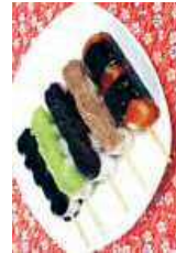
滝見だんご Takimi Dango