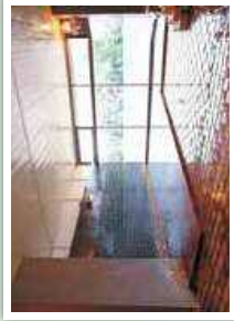
深泉閣 (大浴場) Keisenkaku (public bath)