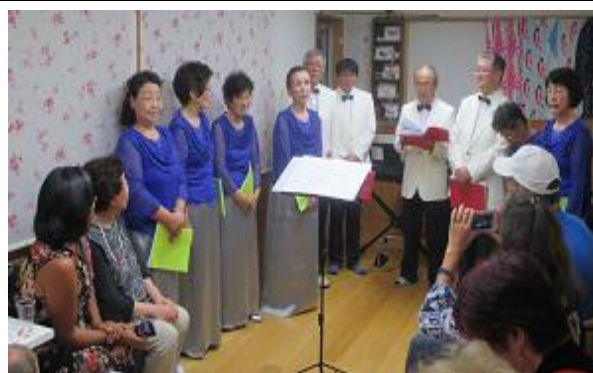
ウェルカムパーティー