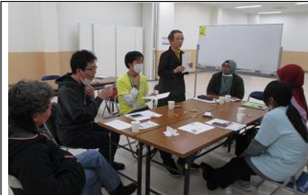
グループでの話し合い

他国の人たちとのコミュニケーションを体感する。アジアの国々の留学生も参加があり、震災関連の単語についても触れることが出来た。神戸大学院国際協力学科協力