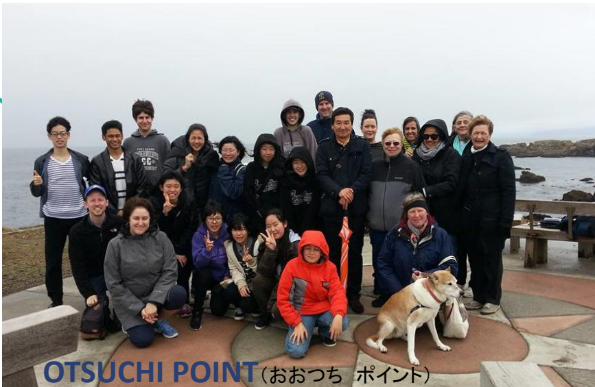
OTSUCHI POINT (おおつち ポイント)