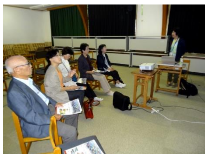
9/23 「会員研修バスツアー」 遠野グローバルプラザ見学・講話