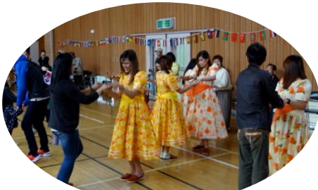
6/4 「金ヶ崎 DE Music&Dance フェスタ」