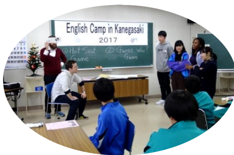
12/17 「英語キャンプ」 金ヶ崎中 1・2 年生が英語で過ごす 1 日。