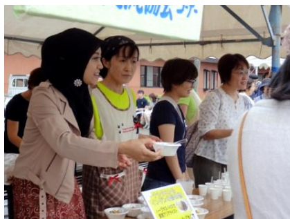
8/21 「農業まつり&米の日」 海外の米料理を試食配布