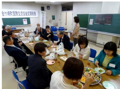
5/13 会員交流会 (定期総会后)