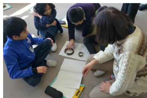
10/27~2/26「国際理解講座」開催 町内各小学校にて(全5回)