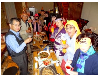
「英会話クラスのパーティ」ハロウィン やクリスマスなどのパーティを開催