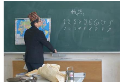
ネパール語の数字