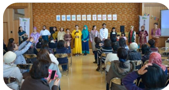
2/5 「金ヶ崎 de 世界の Tea Party」