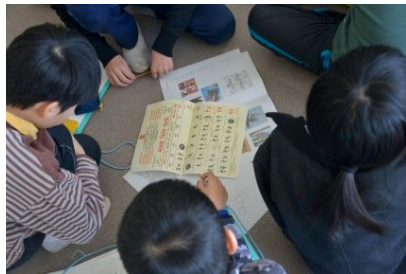
カレンダーはパズル