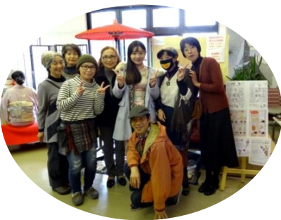
11月 芸文祭・WS 参加 留学生を囲むお茶会、フェア