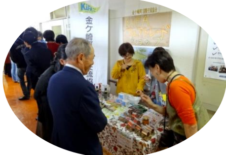
10/15「永岡地区自治振興祭」 フェアトレードショップほか