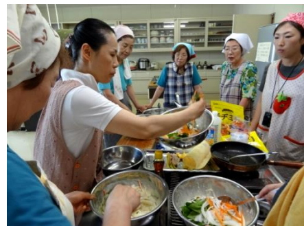
7/11「地区センターめぐり」 韓国料理教室