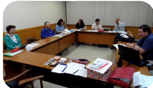
「英会話グループレッスン」 初級～中級の方向けに通年開講