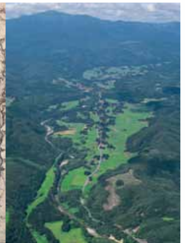
▲ 무츠노쿠니 호네데라무라 평면도