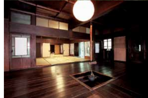
이치노세키 시 센마야 술 곳간 교류시설 (구 요코야 주조·사토케 주택) 메이지 시대부터 다이쇼 시대에 건립된 구라(곳간)군은 국가 유형문화재로 등록되어 있습니다. 다이쇼 낭만을 느낄 수 있는 본체와 서양관이 볼 만합니다. [MAP: 3-E]