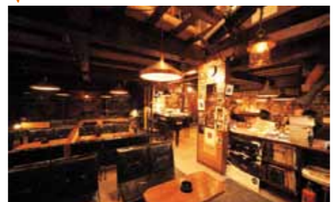
재즈카페 '베이스' 전국에 팬이 있는 재즈카페. 카운트 베이스도 방문했었고 인기 있는 프로의 라이브도 공연됩니다. [MAP: 3-C]