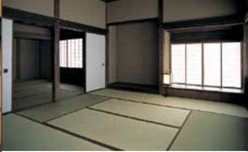
구 누마타케 무가주택 에도 시대 후기, 이치노세키 영 정무를 총괄하는 직책을 맡은 가신 누마타 집안의 주택. 약 300년의 역사를 가진 이곳은 당시 무사의 생활을 엿볼 수 있는 귀중한 건물입니다. [MAP: 3-C]