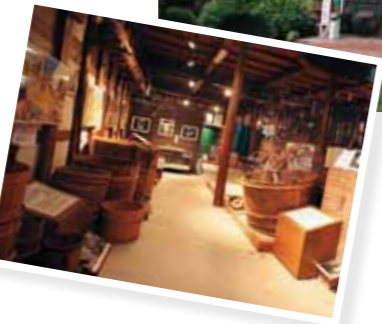
세키노 이치 술 민속문화박물관 예전 그대로의 주조를 소개하는 시설이나 레스토랑 등이 있습니다. 약 100년 전에 세워진 일본·서양의 건축기술이 융합된 역사적으로 가치가 높은 구라(곳간)군. [MAP: 3-C]